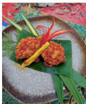
Ayam Masak Berlado

Di samping itu, para hadirin juga dihidangkan dengan sampel makanan warisan agar mereka dapat merasai sendiri keunikan makanan warisan yang telah ditampilkan.