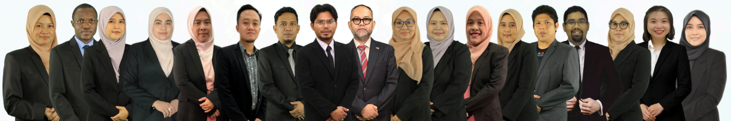
NADI AKADEMIK KESEJAHTERAAN