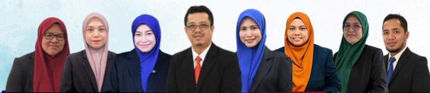
NADI PENTADBIRAN FHPK