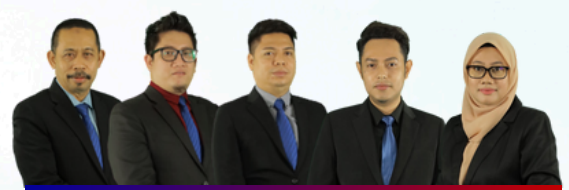
PEMACU "LIVING LAB" FHPK