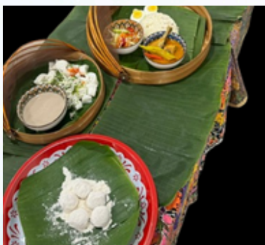
Seleksi makanan warisan Negeri Terengganu

Persembahan makanan warisan ini dilaksanakan sebagai sebahagian daripada pentaksiran berterusan bagi kursus Budaya dan Warisan Makanan (HNB30403) bermula dari 3 November 2025 sehingga 15 Disember 2025. Aktiviti pembelajaran ini telah menerapkan elemen pembelajaran berasaskan pengalaman iaitu Experiential Learning supaya para pelajar dapat lebih memahami dan menjiwai nilai terhadap makanan warisan di Malaysia. Seramai 167 orang pelajar Ijazah Sarjana Muda Keusahawanan (Hospitaliti) dengan Kepujian dan Ijazah Sarjana Muda Keusahawanan (Pelancongan) dengan Kepujian semester 5, 6 dan 7 telah berjaya mempersembahkan kepelbagaian budaya dan makanan warisan bagi 13 negeri di Malaysia.