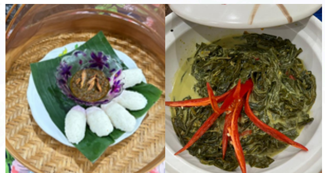
Punten Sambal Hijau

Apa yang lebih menarik, para hadirin juga biasanya dihiburkan dengan persembahan Tarian Rakyat oleh anak negeri seperti tarian Wau Bulan, Ulek Mayang, Joget Pahang, Dabus, Ayam Didik, Canggung, Endang, Joget Kereta Lembu, Zapin, Magunatip dan banyak lagi sambil diiringi irama Lagu Rakyat nan indah lagi puitis yang sarat dengan makna tersurat dan tersirat.