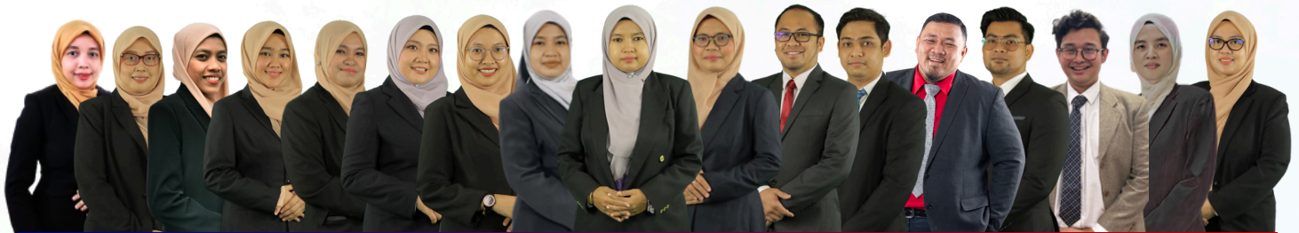
NADI AKADEMIK PELANCONGAN