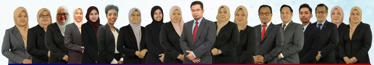
NADI AKADEMIK HOSPITALITI